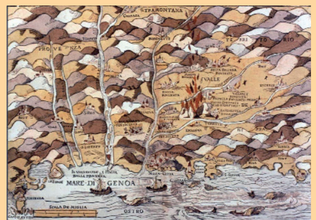
Cette carte représente le « séisme nissart » de 1564 tel qu'il a été perçu par le marchand génois Francesco Maggiol.

- 19 décembre 2000 : une série de secousses de magnitudes 2,8 à 3,5 est ressentie dans les agglomérations de Blausasc, Peille, Contes, Eze, la Turbie, Drap, la Trinité, Nice et Monaco.