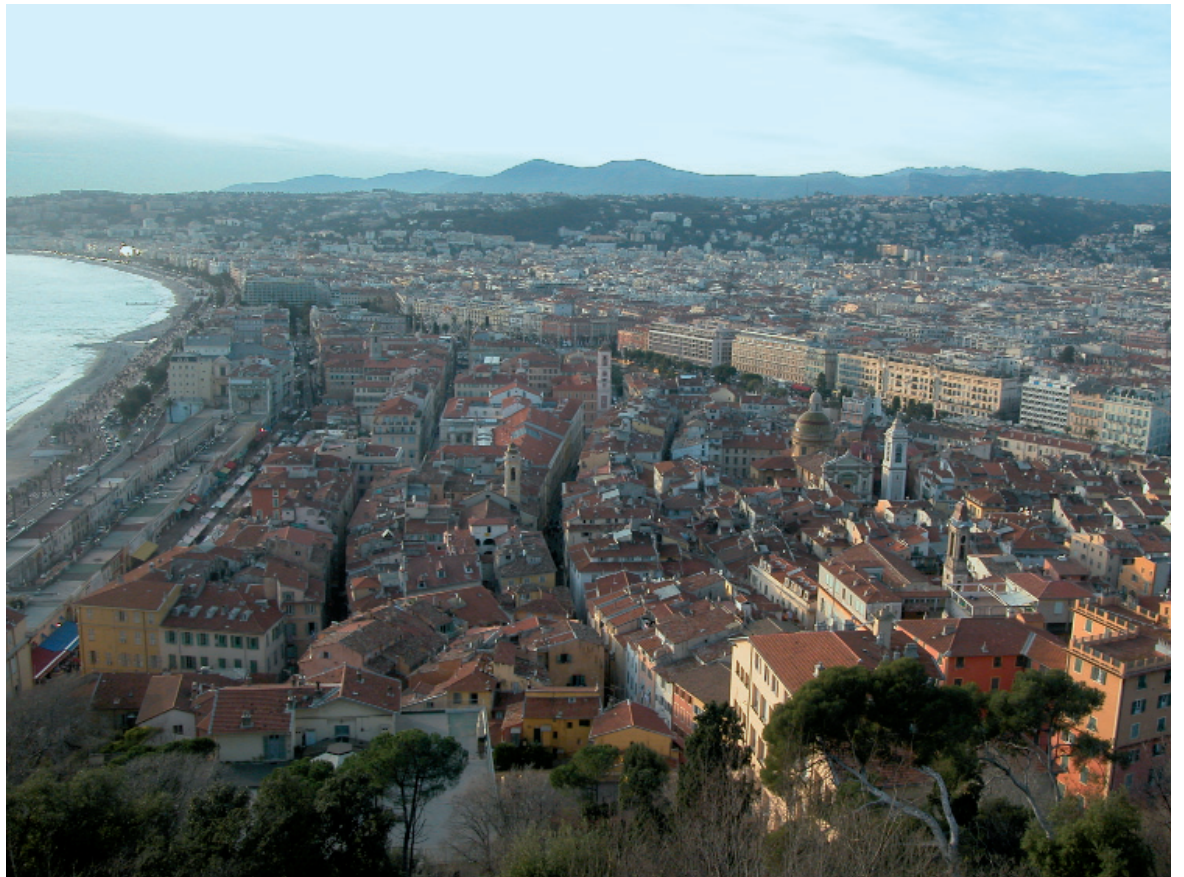
A cause de son bâti ancien, le vieux-Nice subirait de lourds dégâts en cas de séisme.